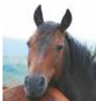
doma i brdski konj