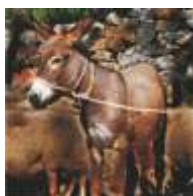
doma i magarac